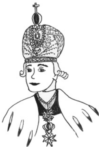
Paul I er

Paul I er n'a qu'un but : la restauration de la monarchie en France et le rétablissement de tous les régimes politiques des états envahis par les Français. Mais, après plusieurs victoires russes (sous les ordres de Souvorov), l'Italie est contrôlée par la coalition, et certains de ses membres oublient les principes de légitimité et transforment la guerre contre la République en une guerre de conquêtes : l'Autriche s'approprie des terres italiennes, les Anglais hissent